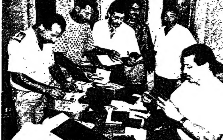
مجلسة معاملات الجوازات